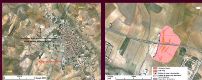
Ubicación de los depósitos estudiados

En el contacto de los depósitos de oleadas basales y los diairos de licuefacción se localizan bandas de material fangoso, carbonatos y evaporitas. Se aprecian marcadas huellas de arrastre.