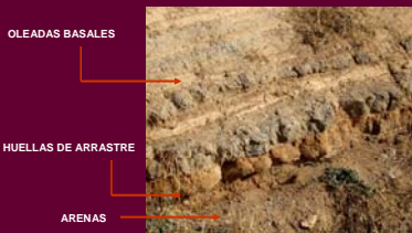
Formaciones de barro y evaporitas en la zona de contacto de materiales