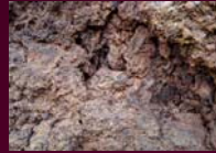
Volcán La Cornudilla