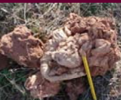
Escorias y jirones soldados