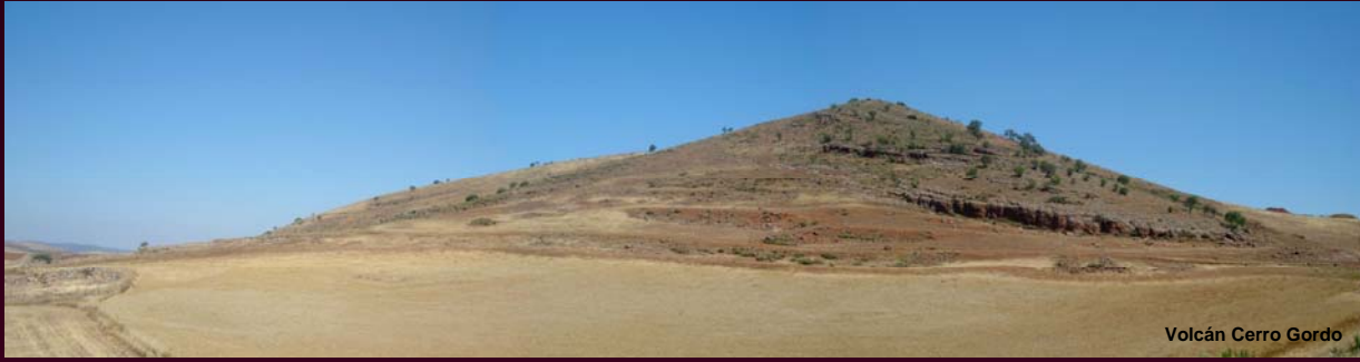
Volcán Cerro Gordo