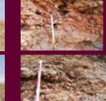
Plastrones de lava

En la parte superior del cono de Cerro Gordo, y hasta media ladera, se localizan mantos de spatter que en función de la dinámica de la fuente de lava, de las características de los clastos y de las condiciones de los apilamientos, no han tenido capacidad de fluir, mostrándose como depósitos de piroclastos soldados.