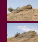
Borde del cráter