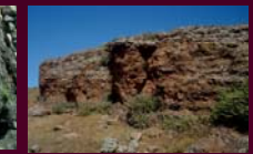
Volcán Cerro Gordo