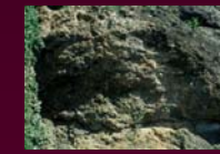
Peñón de Ciruela