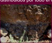
Nivel basal de lava clastogénica

Lavas clastogénicas forman acumulaciones de base que han podido actuar como niveles de deslizamiento, favoreciendo el movimiento del conjunto; así como bandas y lentejones de este material distribuidos por todo el depósito.