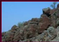
Volcán Cuevas Negras

En los volcanes del Campo de Calatrava son frecuentes las acumulaciones de spatter de diversa entidad (H. Pacheco, 1932), (González, 1996). Además se constata la presencia de conchales de escorias ( spatter cones ) desarrollados en breves eventos eruptivos generados a lo largo de fisuras, abiertas en los flancos de las sierras paleozoicas, que forman pequeños amontonamientos de material escoriáceo aglutinado y plastrones de lava fuertemente soldados, construyendo estos pequeños edificios volcánicos, como es el caso del afloramiento eruptivo de La Sima (Becerra, 2007) y de la fisura del entorno de Casas de Ciruela.